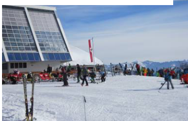
Hinauf mit der Olympiabahn zur Bergstation Hoadlhaus auf 2340 Meter mit einer grandiosen 360 Grad Rundumsicht.

Zum Abschluss noch ein kleiner Einkehrschwung ins Dohlen Nest zum Erwärmen an der Feuertonne und dann ab zum Bus wo sich alle einig waren einen schönen Skitag erlebt zu haben.