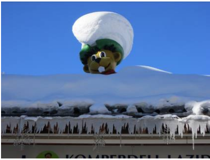
Murmili das Maskottchen setzt ebenfalls alles auf eine Kappe und freut sich über den vielen Schnee auf dem Dach der Talstation Komperdell-Lazid