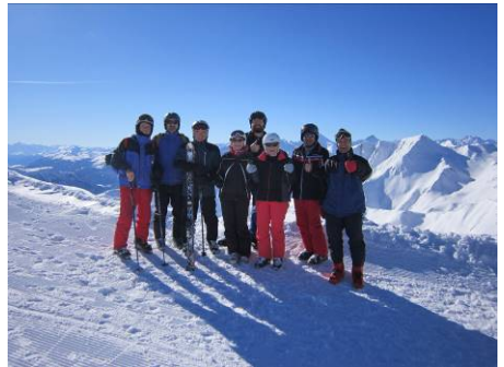
Auf dem Panoramaplateau am Pezid auf 2770 Meter mit einer grandiosen 360 Grad Rundumsicht