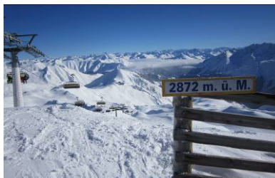
Von der Bergstation Greifspitze 2872 Meter über den Palinkopf geht es auf dem Dutyfree-Run wieder hinab zur Talstation nach Samnaun.