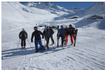
Von der Pardatschgratbahn bei besten Schneeverhältnissen hinein in das Velill-Tal auf eine der schönsten Abfahrten des Skigebiets.