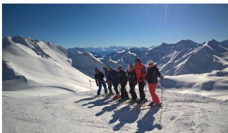
Hinauf bis zum Masnerkopf auf 2820 Meter dem höchsten Punkt des Skigebiets mit der Hochebene am Reschenpass und dem Ortler im Hintergrund.