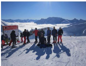
Von der Talstation Samnaun geht es mit der 180 Personen fassenden Doppelstockkabinenbahn hinauf zum Alp Trida Sattel auf 2488 Meter direkt in die weisse Arena von Ischgl-Samnaun.