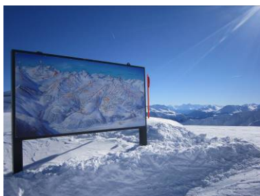
Serfaus-Fiss-Ladis die Ski-Dimension im Oberinntal bestens ausgeschildert und mit einem Sonnenspot beleuchteten Pistenplan.