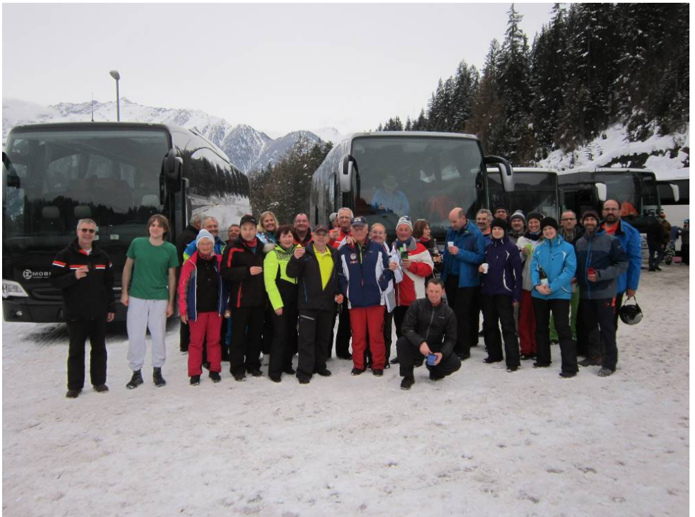
Gut gelaunt und zufrieden nach 4 - Tagen Genuss-Skifahren waren sich beim Abschlussfoto alle wieder einig: Es hat super Spaß gemacht!