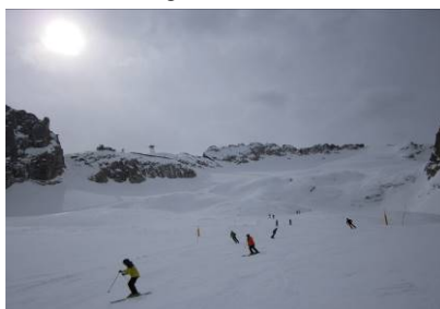
... und mit der anschließenden 12 km Abfahrt ins Tal, das ist schon ein besonderes Erlebnis.