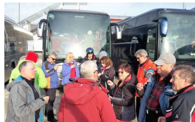
Und nach einem gelungenen Skitag Apresski am Bus.....