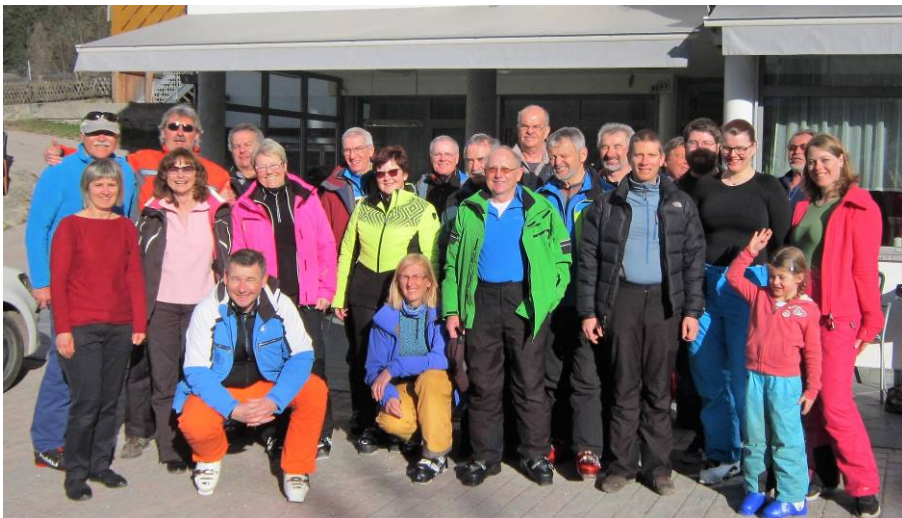
Beim Abschiedsfoto vor unserem Hotel Elisabeth mit strahlenden Gesichtern und guter Laune waren sich dann alle einig - Spaß hat's gmacht und Südtirol ist immer eine Reise wert.