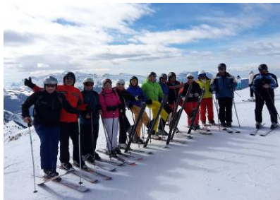
Tolle Panoramablicke vom Seceda Skigebiet ...

Sella Ronda, Alta Badia, Marmolada, Lagazuoi oder St. Christina die Möglichkeiten von der Corvara Talstation sind einfach gigantisch: