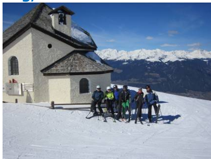
Skifahren auf der Sonnenseite der Alpen mit grandiosem Blick Richtung Alpenhauptkamm und dem Pustertal.