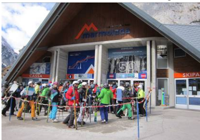
Von der Marmolada Talstation Malga Ciapela hinauf zur Terrazza Panoramica auf 3265m ...