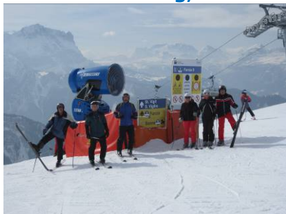
Auf dem Kronplatz (2275m) angekommen bei einer herrlichen 360 Grad Rundumsicht mit der Marmolada im Hintergrund.