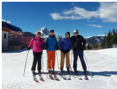
... an so einem Tag darf die Piculin nicht fehlen !