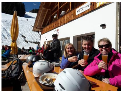
Sonnenschein und strahlende Gesichter an der Marchner Hütte.....